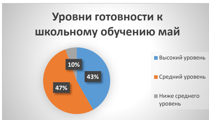
Рис.1 Уровни готовности к школьному обучению