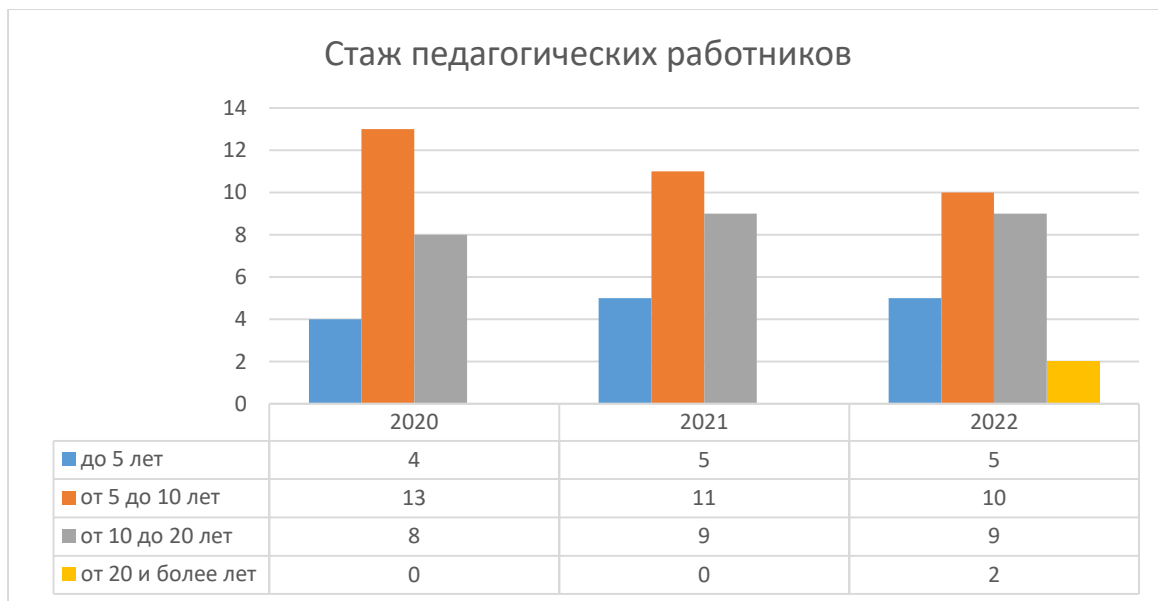
Диаграмма с характеристиками кадрового состава МБДОУ «Детский сад №121»